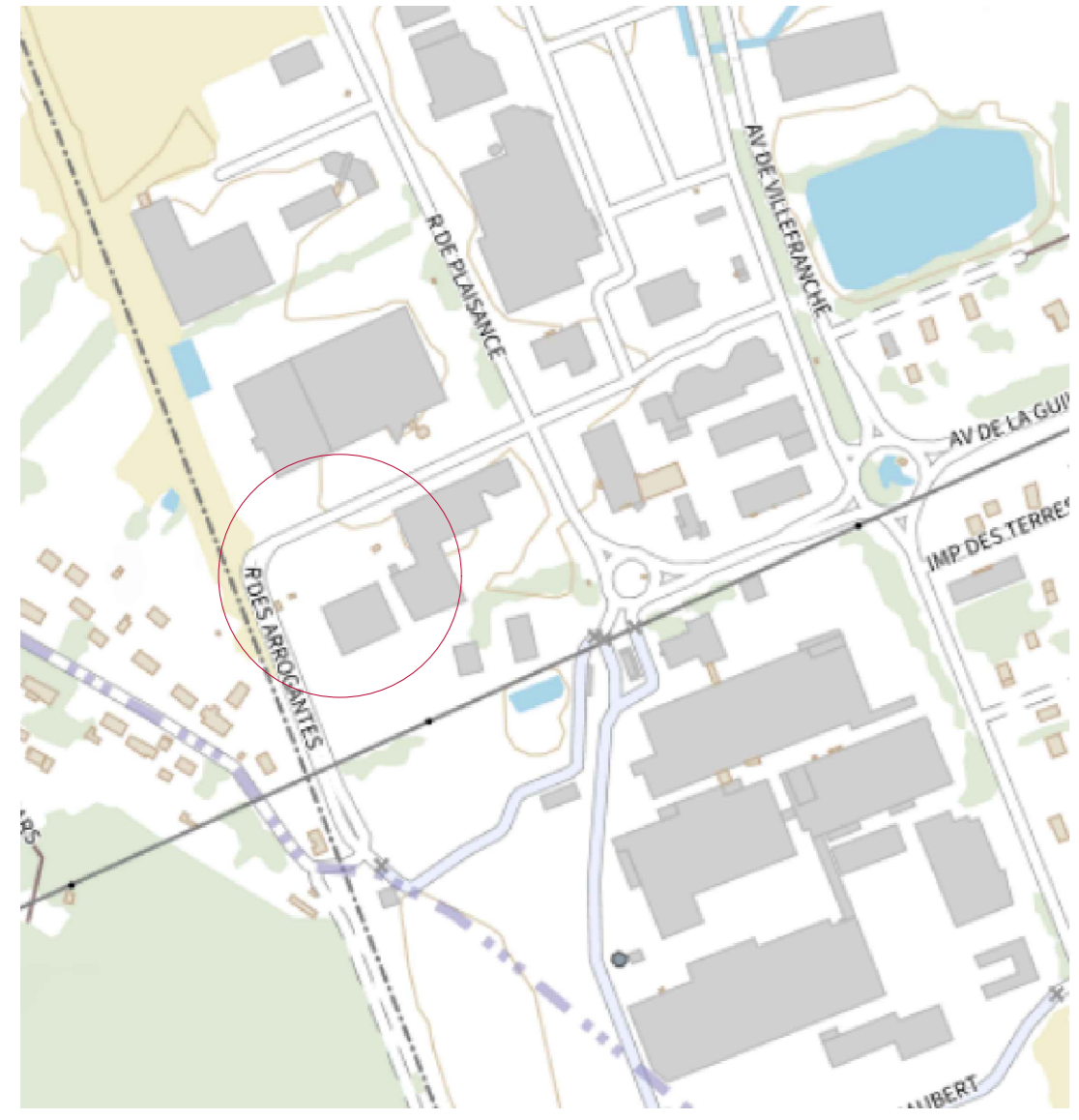
Déchetterie Rue des Arrogantes 41200 ROMORANTIN LANTHENAY